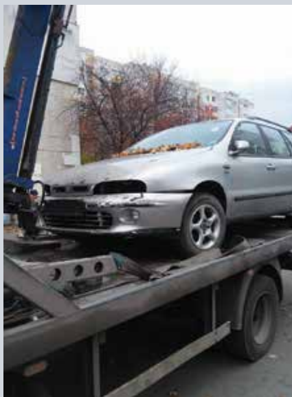
Колите се вдигат от специализирана фирма.

300 излезли от употреба коли, заемащи паркоместа или спрени в зелени площи, бяха премахнати от началото на годината.