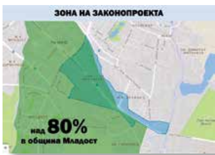
Десетки декари влизат в предвидената зона